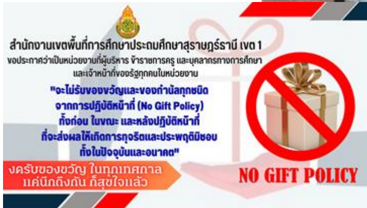
(2) วารสารเขตพื้นที่สุจริตออนไลน์