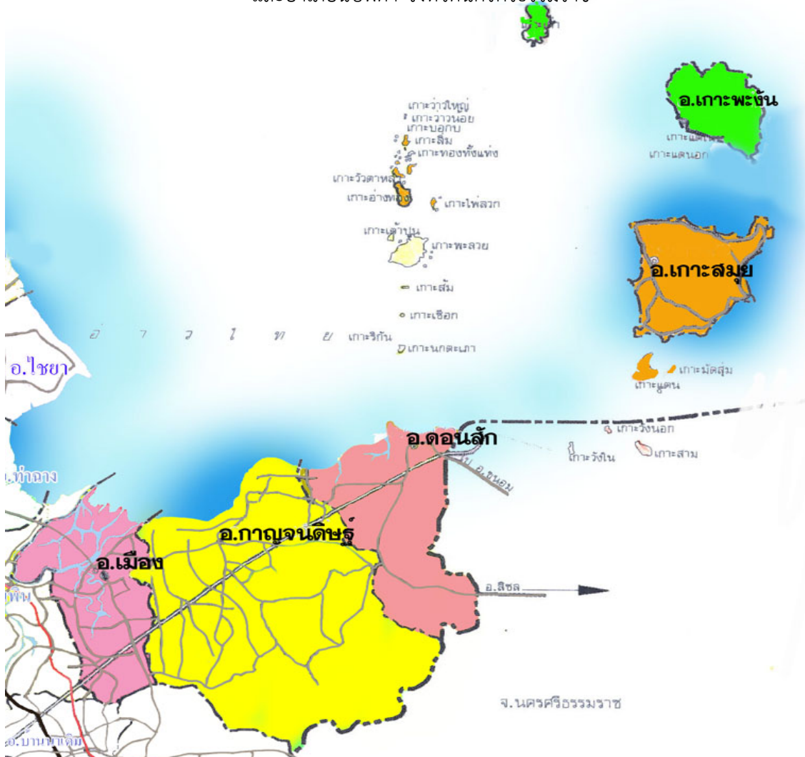
ภาพที่ 1 แผนที่เขตบริการเขตพื้นที่การศึกษาประถมศึกษาสุราษฎร์ธานี เขต 1