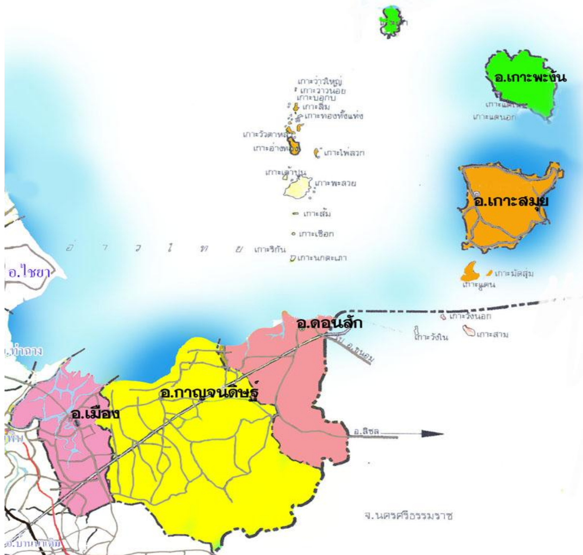
แผนภาพที่ 2 แผนที่เขตบริการเขตพื้นที่การศึกษาประถมศึกษาสุราษฎร์ธานี เขต 1